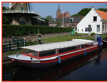
Gantel 6 (max. 32-38* p.)