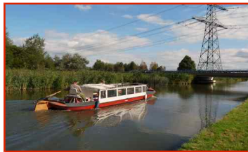
Gantel 4 (max. 22* p.)

*maximum aantal personen volgens certificaat I.L.T.